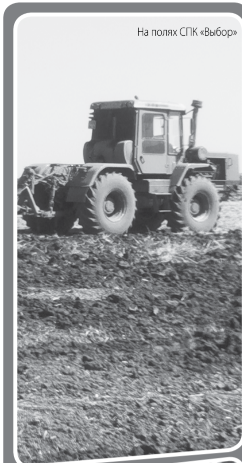
На полях СПК «Выбор»

Наши успехи достигаются ещё и благодаря государственной поддержке. В 2022 году сель-