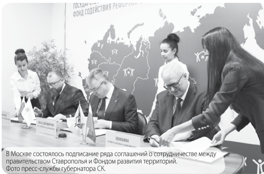
В Москве состоялось подписание ряда соглашений о сотрудничестве между правительством Ставрополья и Фондом развития территорий.

Отметим, что в рамках намеченных планов предпо-